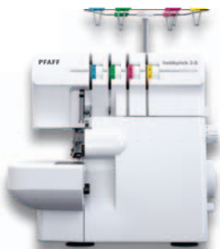
Multifunzionale | Veloce | Precisa